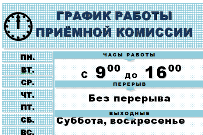
ГРАФИК РАБОТЫ ПРИЁМНОЙ КОМИССИИ